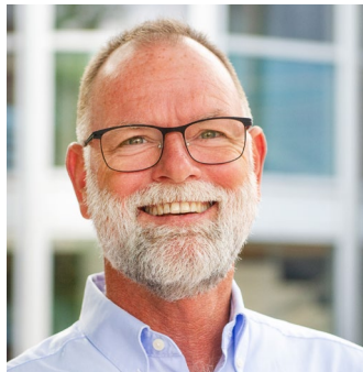
TALARE 3/12 KL 13.05

Bredbandskoordinator, Västra Götalandsregionen