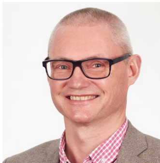
TALARE 3/12 KL 10.30 OCH 13.05