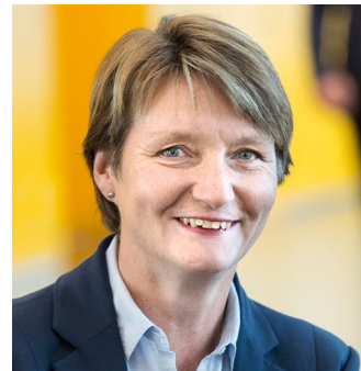
TALARE 3/12 KL 13.50