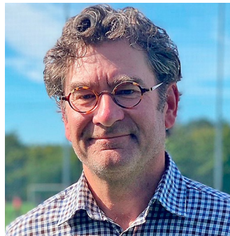
TALARE 3/12 KL 13.05